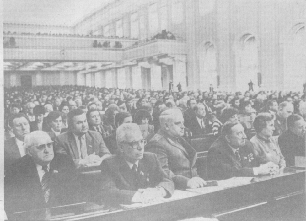
НА СНИМКАХ: совместное заседание Совета Союза и Совета Национальностей; на трибуне — Генеральный секретарь ЦК КПСС М. С. Горбачев.

Выступающий подчеркнул, что план на 1986 год разработан в соответствии с