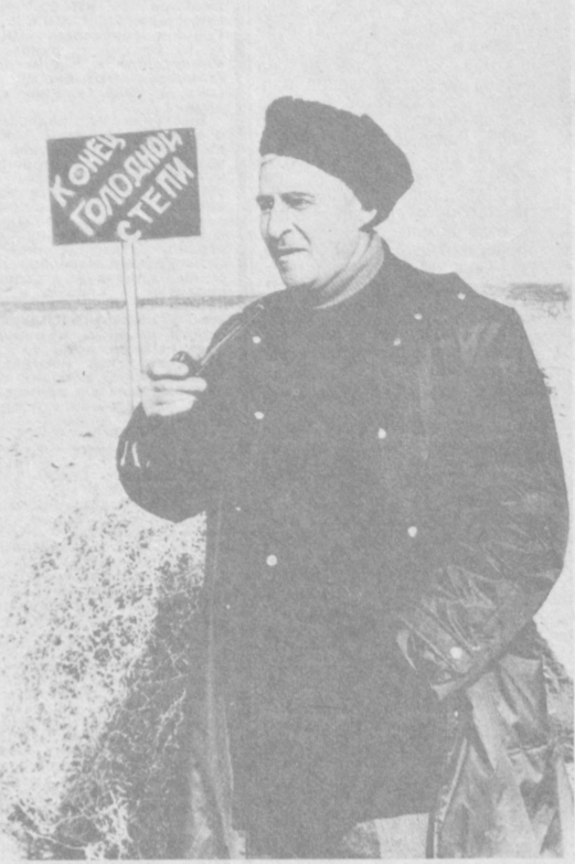
Этот снимок представляет символический край, который хорошо знал, который многие годы вдохновлял его, воспринимая энтузиазмом первооткрывателя, их неустойчивой верой в победу...