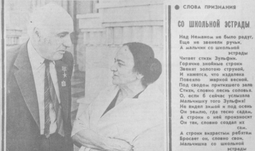
Им есть о чем говорить. НА СНИМКЕ: Зульфийа и известный грузинский поэт Иранлий Абашидзе.

Главный библиограф Бузарской областной библиотеки имени Иби Сины.