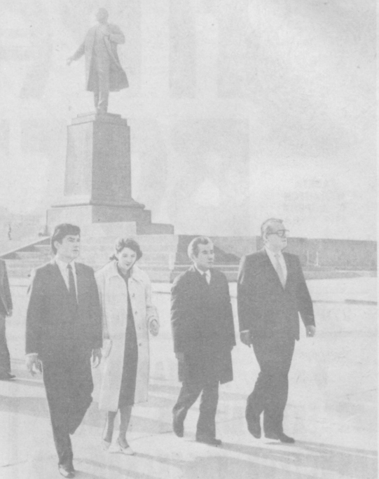
Делегация Союза коммунистов Македонии на площади имени В. И. Ленина в Ташкенте.