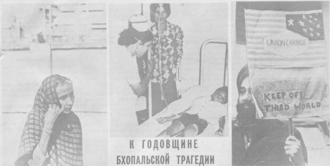
К ГОДОВЩИНЕ БХОПАЛЬСКОЙ ТРАГЕДИИ

В Индии не забыты страшные последствия трагедии, произошедшей в декабре прошлого года в городе Бхопал (штат Мадхья-Прадеш) во время американского концерта «Юнион карбайд». Тогда из-за утечки ядовитого газа на принадлежащем этой корпорации химическом заводе погибло более двух с половиной тысяч бхопальцев и десятки тысяч остались инвалидами на всю жизнь. Кроме закрытия ворот химического завода ежедневно приходило сотни людей. Это родственники бхопальцев, жертвы катастрофы, страдающие различными заболеваниями, вызванными отравлением. Этих людей ведет сюда чувство гнева и возмущения в отношении законных правителей, отнявших у них родных и близких, лишивших их здоровья и возможности работать. Расследование обстоятельств катастрофы, происшедшей в