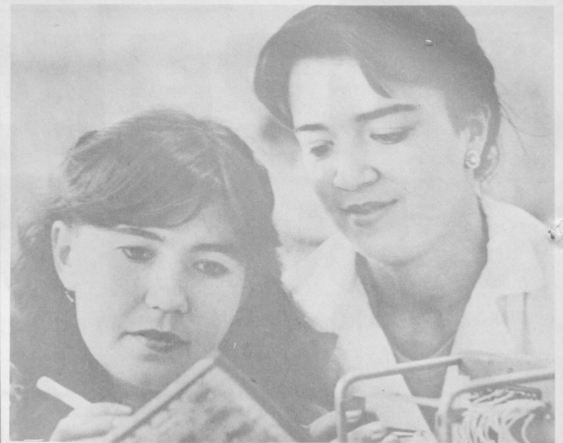
Самаркандский завод «Инап» им. 60-летия СССР выпускает звуковоспроизводящую, синхронизирующую аппаратуру для кинозалов и театров страны. Коллектив предприятия сейчас занят усовершенствованием новых установок и узлов, необходимых для улучшения кинообслуживания населения.

Ю. КУЗЬМИН. Соб. корр. «Правды Востока», Бухарская область.