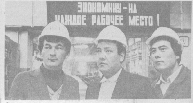
Высокие производственные результаты достигаются в бескомпромиссном социалистическом соревновании коллектива компрессорной станции, обслуживающей главные газовые артерии Средней Азии. Высококвалифицированные рабочие и специалисты станции обеспечивают не только безотказную работу оборудования, но и постоянную экономию ресурсов и в частности дорогостоящего турбинного масла.