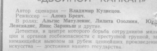
Производство Рижской киностудии.