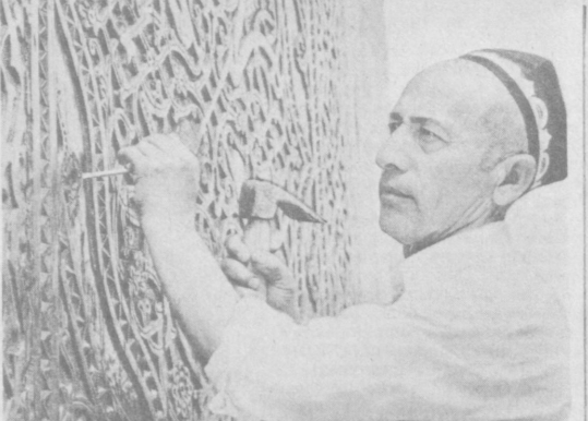
С глубоким уважением мы чтим память тех, кто отдал свои жизни за становление и укрепление Советской власти в Узбекистане. В тех местах, где происходили незабываемые события, установлены памятники. Одним из таких исторических памятников в Анджане является крепость, построенная в 1880 году после присоединения Туркестанского края к России. В этой крепости в 1917-1919 годах создавались Советы солдатских депутатов, формировались красные армейские отряды. По инициативе Анджанского обкома партии и облисполкома приняты меры по реставрации крепости и созданию мемориала героям гражданской войны. Уже завершена реставрация главного фасада, коло-западной стены, казармы и гауптвахты.