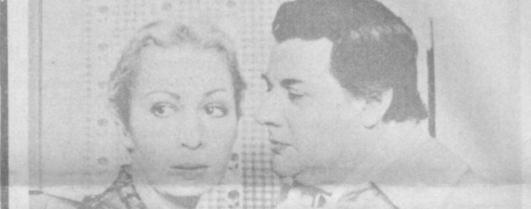
Производство киностудии «Мосфильм».