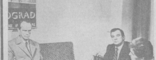
Производство Рижской киностудии.