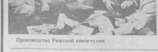
Производство Рижской киностудии.