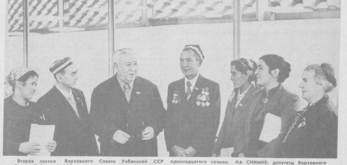
Вторая сессия Верховного Совета Узбекской ССР одиннадцатого созыва. НА СНИМКЕ: депутаты Верховного Совета Узбекской ССР в перерыве между заседаниями.

Сегодня энергетика Узбекистана является передовой отраслью народного хозяйства, которая полностью