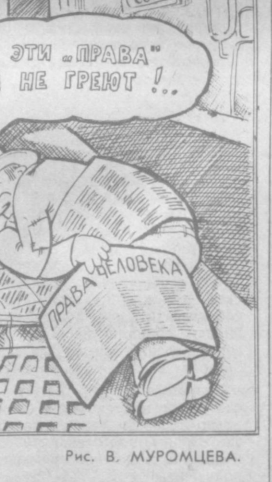
Рис. В. МУРОМЦЕВА.

«Вентиляционные решетки, скамейки парков, пустые картонные ящики — такой «приют» уготован миллионом отверженных американцев лишившихся работы, средств к существованию и крыши над головой. Это была истинная цена, которую платят простые люди за «демократию» Вашингтона, разлагающегося о правах человека».