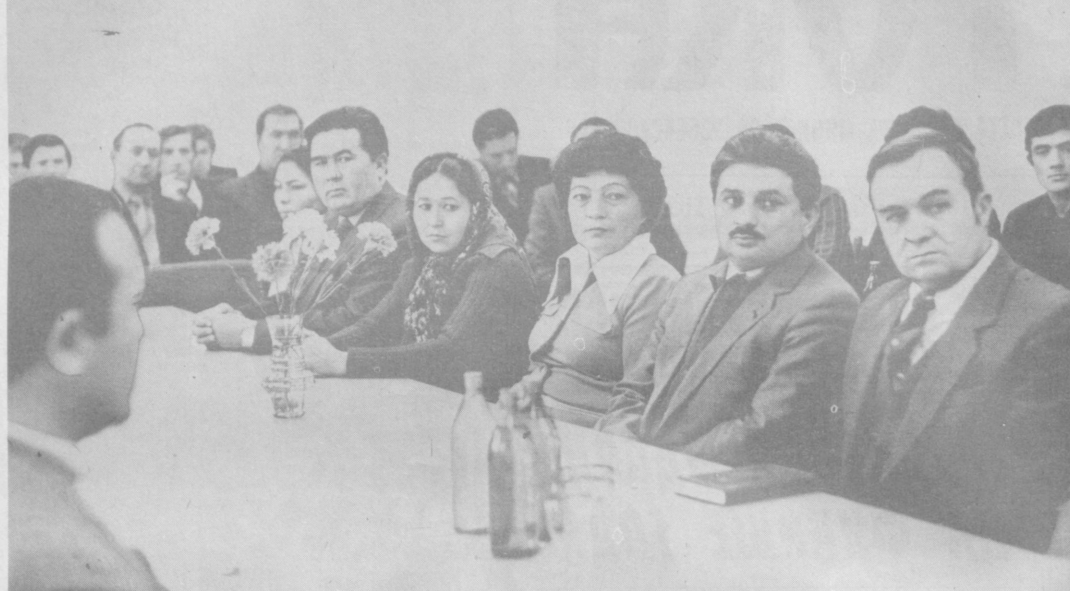
НА СНИМКЕ: участники заседания.