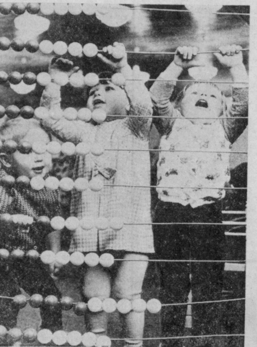
Международный год ребенка. На снимках: слева — первые шаги в науку (Польша); справа — «Ну как, вкусно!» (Япония).