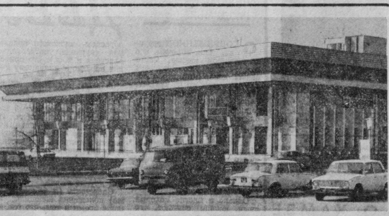
В Намангане построен новый современный аэровокзал, оборудованный по последнему слову техники. Для пассажиров созданы здесь все удобства. На снимке: внешний вид здания аэровокзала.