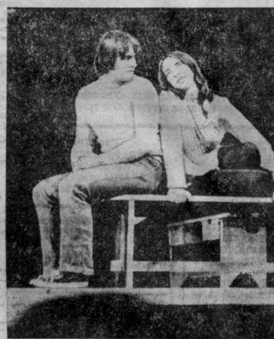
Сцена из спектакля «Конь».

Великолепно сложенные, закрученные за спины руки, грациозно, как горячие скакуны, гарцующие Коней периодически врываются на сцену. Как свежий ветер, вихрь, как образ Свободы. Воли, о которых мечтает, к которым рвется герой, еще