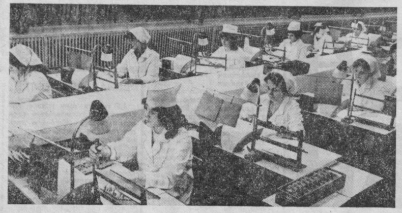
Самаркандский завод «Кинал» — единственное в стране предприятие по выпуску звуко-технической, силовой и распределительной аппаратуры для кинотеатров. Сейчас здесь осваивается изготовление продукции на трансформаторах. Коллектив завода борется за досрочное выполнение задания десятой пятилетки. На снимке: монтаж узлов электронной аппаратуры в сборочном цехе завода.

После того собрания многое изменилось и в организационном, и в материально-техническом снабжении. Усилили мы поиск резервов экономии и внутри бригады. Приведу несколько примеров. Тщательнее мы стали изучать фронт предстоящих работ, принимать, как осуществлять, допустим, планировку с меньшим числом прохода механизмов на участке, как лучше совместить работу и операции за один проход. Более тщательно регулировали топливную аппаратуру, внимательно стали относиться к профилактическим работам, подго-