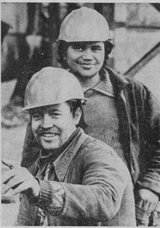
ФОТОРЕПОРТАЖ СО СТРОЙКИ

Во многих колхозах и совхозах области внедрена безарядная звеньевая система. Этот прогрессивный способ, основанный на разделении труда по конечному результату — полученному урожаю, необходимо применять повсеместно. Он позволяет ответственность хлопководов за труд, служить хорошим стимулом для роста производительности труда.