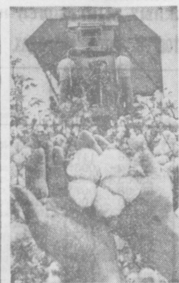
● ГВАРДЕЙЦЫ УБОРКИ

В начале июня, когда хлопчатник обычно бутонизирует, сильнейший град в считанные минуты уничтожил все посевы. В третий раз сев начинался заново. Слезы стояли тогда в глазах у этого много повидавшего человека. Но сегодня его настроение хорошее. Он счастлив, потому что в этот раз сев начинался заново. Слезы стояли тогда в глазах у этого много повидавшего человека. Но сегодня его настроение хорошее. Он счастлив, потому что в этот раз сев начинался заново.