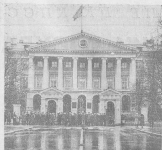
В эти предпраздничные дни ленинградцы и гости города на Неве посетили памятные исторические места, связанные с именем В. И. Ленина, с подготовкой и свершением Великой Октябрьской социалистической революции. На снимках: у Смольного; у легендарного фрейера «Арора».

Совещание проходило в атмосфере единства и братской дружбы.