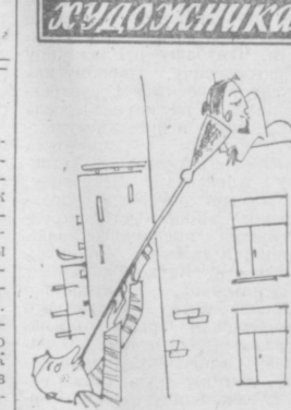
— Поидем погуляем?