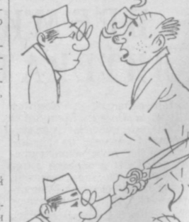
Рис. В. ДУМКИНА.