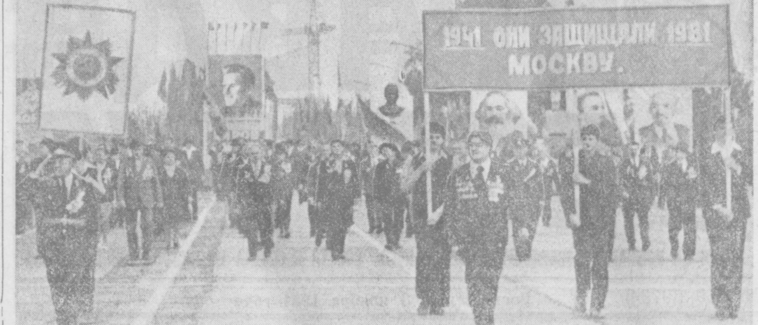
Участники героической битвы под Москвой в праздничных колоннах на площади В. И. Ленина.

Репортаж с Красной площадью вел корреспондент ТАСС Л. ЕРМАКОВА, В. БЕЗВРЕДНЫЙ, М. БОРОДИНА, Ю. БУРЯК, П. РЯБОВ.