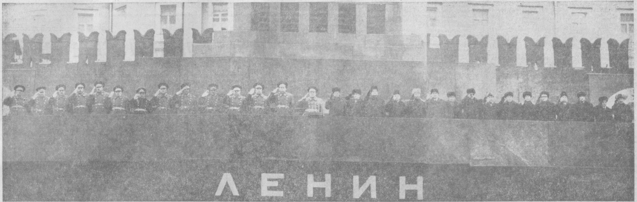
МОСКВА. Празднование 64-й годовщины Великой Октябрьской социалистической революции. На снимке: на трибуне Мавзолея В. И. Ленина.