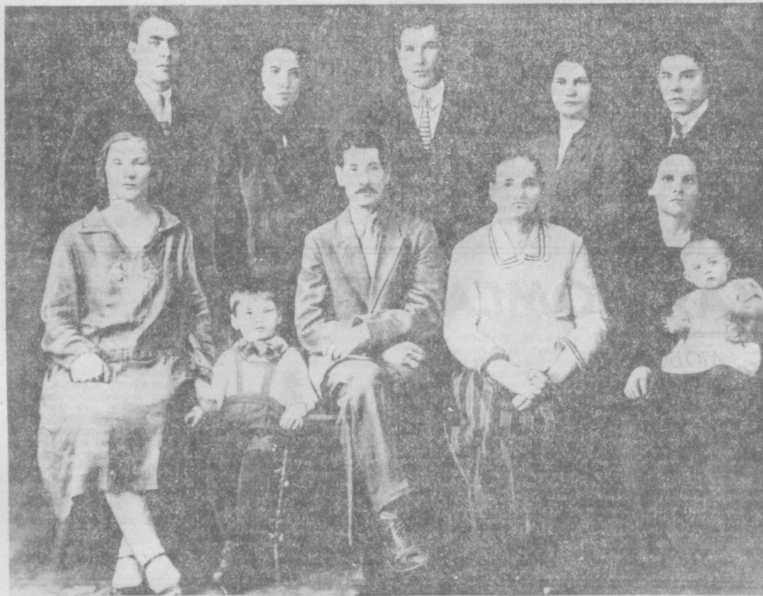
Днепропетровск. Семья Брежневых. Л. И. Брежнев в верхнем ряду слева.

Чувство Родины у каждого из нас начинается с памяти детства, со своего дома, своей улицы, своего города или села. И вместе с тем живо в нас ощущение большой, великой Родины, которая в дни опасности и больших испытаний все от края и до края становится вдруг до боли банана и дорога.