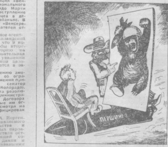
Заоеканский аттракцион. Рис. А. САФРОНОВА.