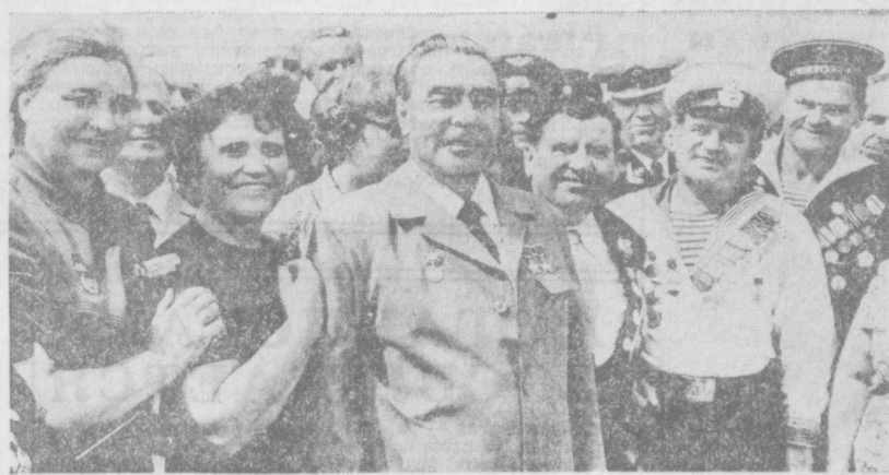
Л. И. Брежнев среди малоземельцев, Новоросийск, сентябрь 1974 года.