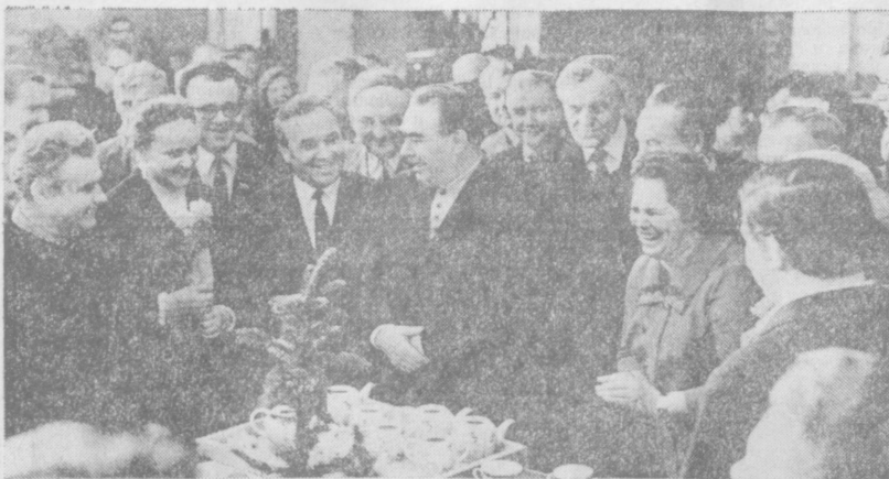
Л. И. Брежнев среди рабочих фарфорового завода имени Ломоносова, Ленинград, 1971 год.

Что это? Воспитание своего рода удаля? Нет, мы понимали приказ комбата так, что он нас готовит к любым