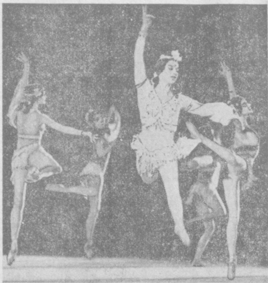
На снимке: сцена из спектакля «Индийская поэма».

БОЛЬШОЙ театр Союза ССР — это волшебный мир прекрасного. Без преувеличения можно сказать — его искусство знают во всех уголках земного шара, его послания выступают на лучших сценах мира, и всюду им рукоплескали восторженные артисты — за Правду и Красоту, великие гуманистические идеи истинного Искусства.