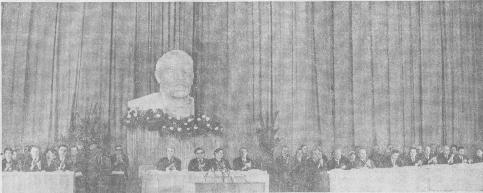
Ташкент, 26 ноября. Заседание Верховного Совета Узбекской ССР.