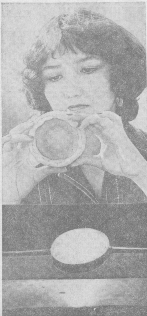
Солнце плавит металл. В Физико-техническом институте имени С. В. Стародубцева АН УзССР разработаны и испытаны высокотемпературные термоконцентраторы, позволяющие получать температуру до 4 тысяч градусов по Цельсию.

ФЕРГАНА. (Юб. корр. М. Лурье). Большой популярностью пользуются у жителей областного центра туристические маршруты выходного дня. В субботу и воскресенье любители активного отдыха могут побывать в живописных уголках Хамзабада, посетить Голубое и Зеленое озера, совершить экскурсионные поездки в местонахождение боевой и трудовой славы. Для горожан разработаны маршруты на зимний и весенний периоды.