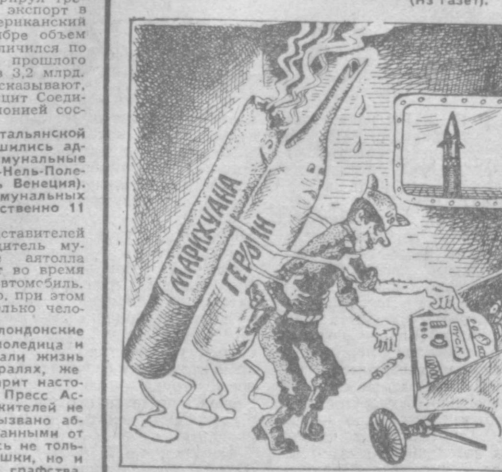
Рис. А. Сафронов.

Наркомания в вооруженных силах США приобретает все более угрожающие масштабы. Об этом свидетельствуют результаты исследования, проведенного на авиабазе Хиннам (штат Тавизи), где проводится систематическое испытание ракетного оружия. Анализ показал, что из тридцати отобранных наугад военнослужащих девятьдесят шесть употребляют марихуану. Известны также факты употребления наркотиков военнослужащими, обслуживающими межконтинентальные ракеты с ядерными боеголовками.