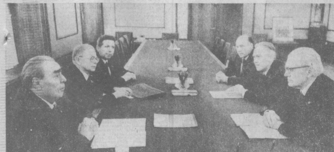
Во время беседы.