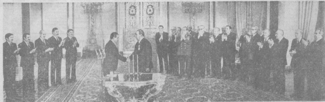
Во время вручения награды.

Генеральный секретарь ЦК НДПА, Председатель Революционного совета ДРА Бабакар Кармаль 16 декабря в Кремле вручил Генеральному секретарю ЦК КПСС, Председателю Президиума Верховного Совета СССР Л. И. Брежневу высшую награду Демократической Республики Афганистан — орден «Солнце свободы».