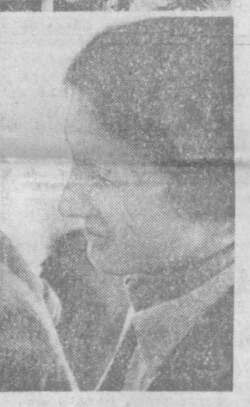
Знаменитый актер Равиль Тумашев в роли Ходжи Насреддина.

Гастроли Татарского государственного театра драмы и комедии явились большим событием в культурной жизни нашей республики.