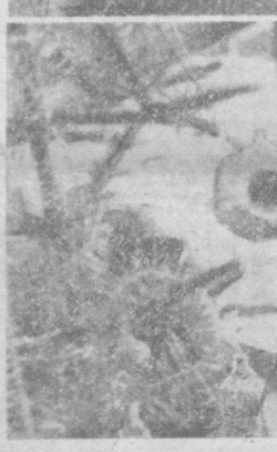
На снимках: новогодний базар в детском мире.