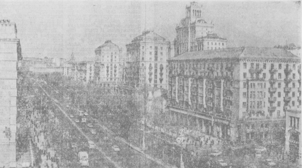
На снимке: центральная магистраль г. Киева — Крещатик.

Седьмая неделя юбилейной ударной вахты — в честь Украинской ССР