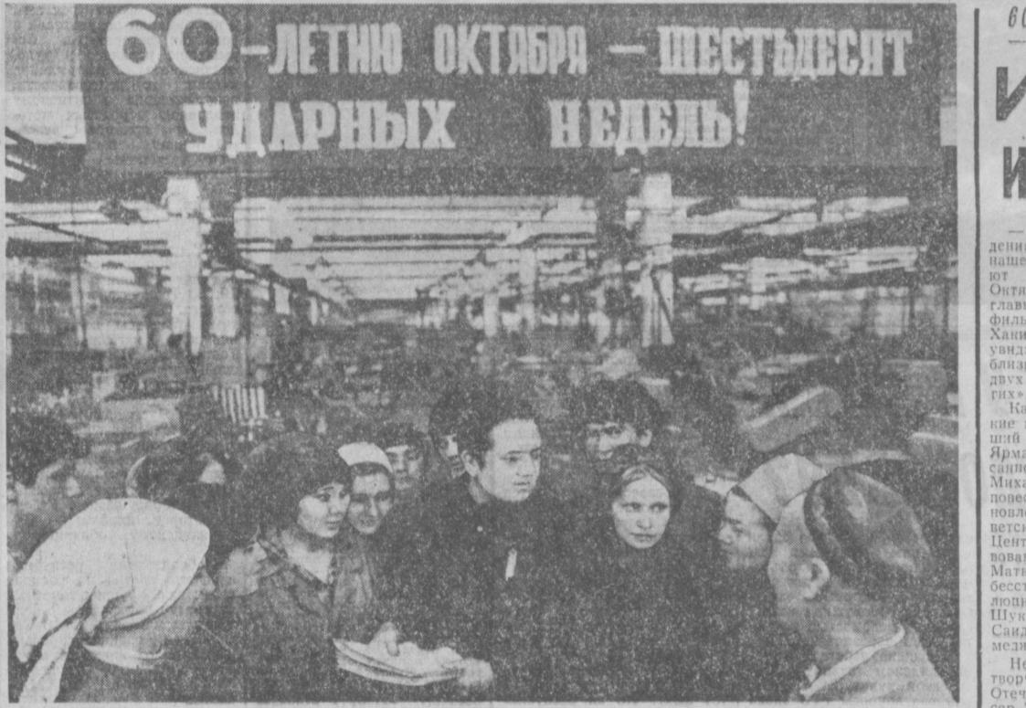
60-летию Октября — шестьдесят ударных недель! Коллектив орденов Ленина и Трудового Красного Знамени завода «Ташкентсталь» успешно выполнил задание 1976 года. Включившись во всенародное социалистическое соревнование за достойную встречу Великого Октября, труженники предприятия решили выполнить план второго года пятилетия досрочно, 28 декабря, и дополнительно реализовать программу на 200 тысяч рублей, выпустить 15 процентов изделий со Знаком качества. На сцене социалистические обязательства в честь 60-летия Великого Октября принимают работники первого механического цеха.

А. МЕЖИКОВСКАЯ. Корреспондент Янгилловской редакции журналистов СССР.