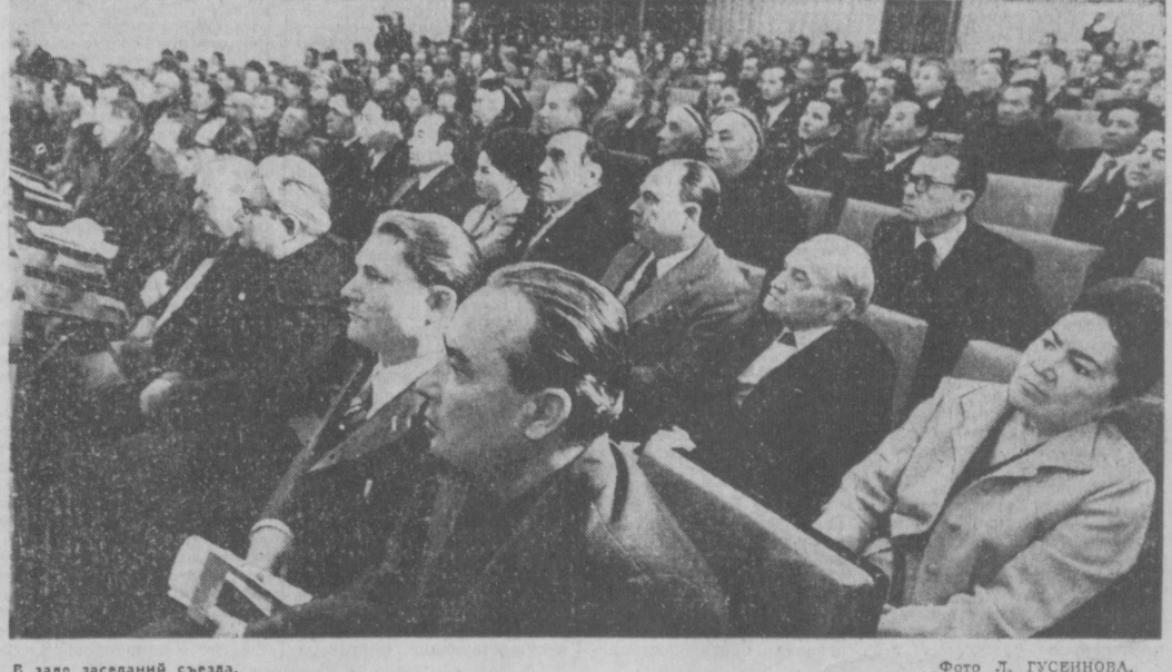
В зале заседаний съезда.