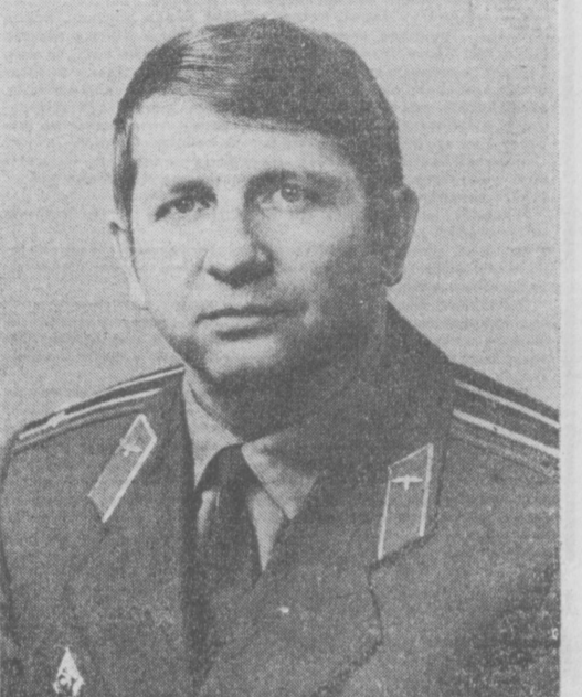
Бортинженер космического корабля «Союз-24», подполковник-инженер Юрий Николаевич ГЛАЗКОВ