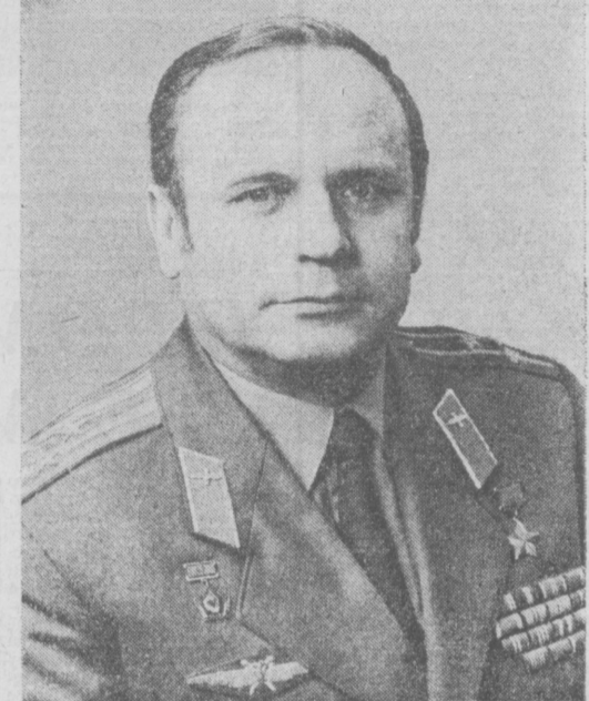
Командир космического корабля «Союз-24», летчик-космонавт СССР Герой Советского Союза, полковник Виктор Васильевич ГОРБАТКО