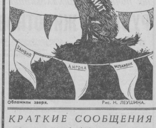
Обложка зверя. Рис. Н. ЛЕУШИНА.

Решительная борьба уже принесла победу металлистам фирмы «Алюва» и рабочим строительной компании «Амекс» в Шатору. Успехом завершения также стачки протеста против массовых увольнений работников фирмы «Керв-Дан» в Марселе и кокаинеров в Ле-Пю.