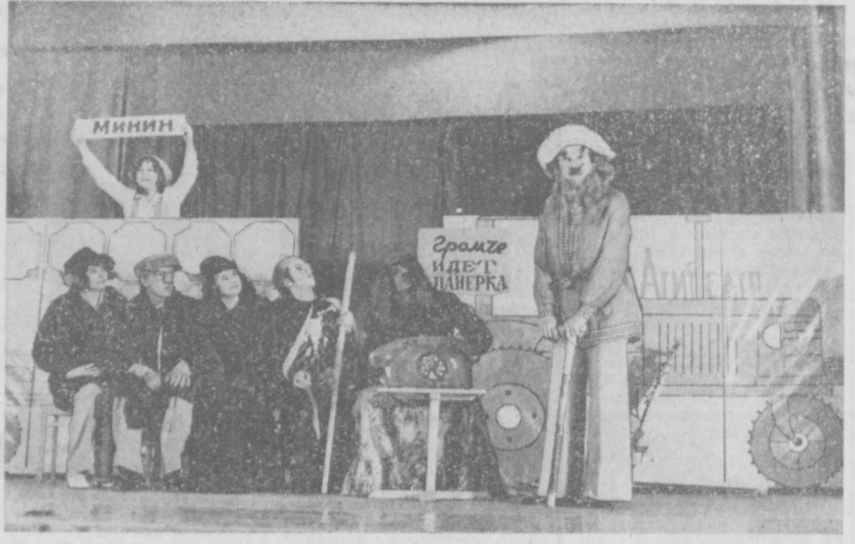
В Самарканде состоялся республиканский смотр-конкурс агитационно-художественных коллективов. В нем приняли участие 20 агитбригад — победители областных смотров. Тепло встретили самаркандцы озорные частушки, зажигательные песни, остроумные репризы, принятые на вооружение агитбригадами — славными наследниками «Синей блузы». На сцене: лауреаты республиканского конкурса агитбригад «Мы — трактористы» Дворца культуры Ташкентского тракторного завода.