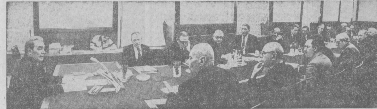
Во время встреч.

Первый материал публикуется сегодня на 3-й стр.