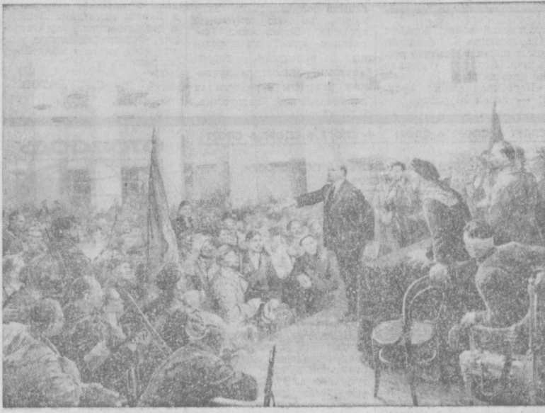
В. И. Ленин на II Всероссийском съезде Советов. С картины художника В. А. СЕРОВА.