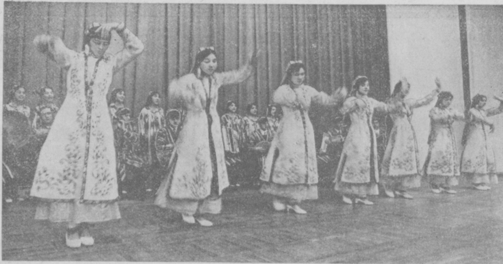
Лауреат смотра художественной самодеятельности коллективов предприятий и организаций Гласредиздатского танцевального ансамбля «Мархаб» территориального управления «Каршистрой».