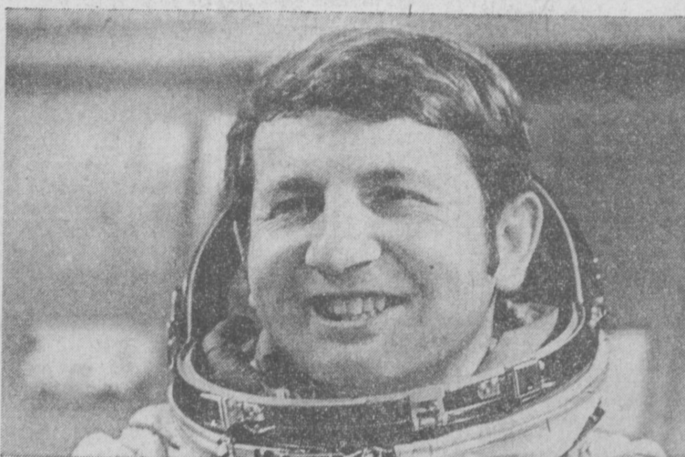
Командир космического корабля «Союз-24» летчик-космонавт СССР, Герой Советского Союза подполковник Виктор Васильевич Горбатко (слева) и бортинженер космического корабля «Союз-24» подполковник-инженер Юрий Николаевич Глазков.