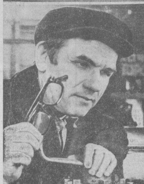
Фото В. СИРОТКИНА и Л. ГУСЕНИНОВА.