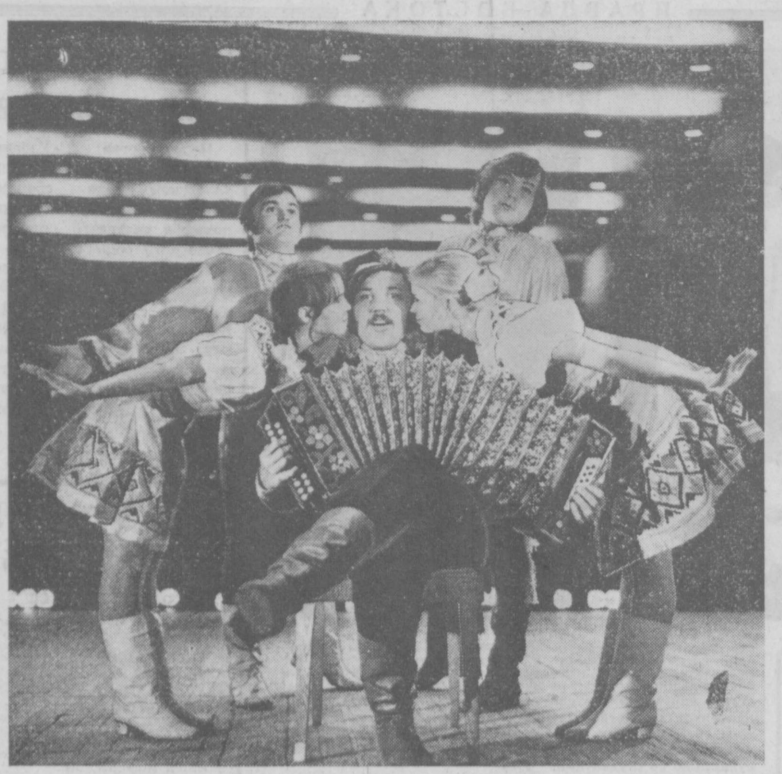
Более 800 рабочих, инженеров, студентов и учащихся города Навои занимается в 20 кружках городского Дома культуры «Фархад». Особенно популярно пользуется ансамбль народного танца. На его концерты всегда собирается много зрителей. За участие в фестивале самодельного творчества трудящихся Узбекистана ансамбль награжден дипломом. В следующем году ансамблю исполняется пять лет. К своему дню рождения коллектив готовит новую концертную программу, в которую включены песни и танцы народов СССР. На сцене ансамбль народного танца выступает на сцене Дворца культуры «Фархад».