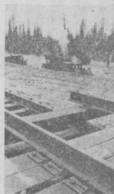
БАМ. Дорога идет дальше, на Уланам.