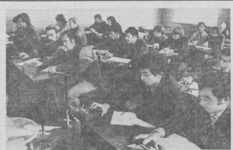
Ташкентское метро еще строится. Не пройдет несколько месяцев, и по подземным магистралям поезда. Поедут электропоезда, обеспечат четкую и бесперебойную работу подземного транспорта выпускники Ташкентского техникума электротехники. На снимке: занятия по электротехнике.