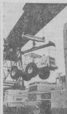
ЛЕНИНГРАД. Отгружен трактор «Кировец К-701».