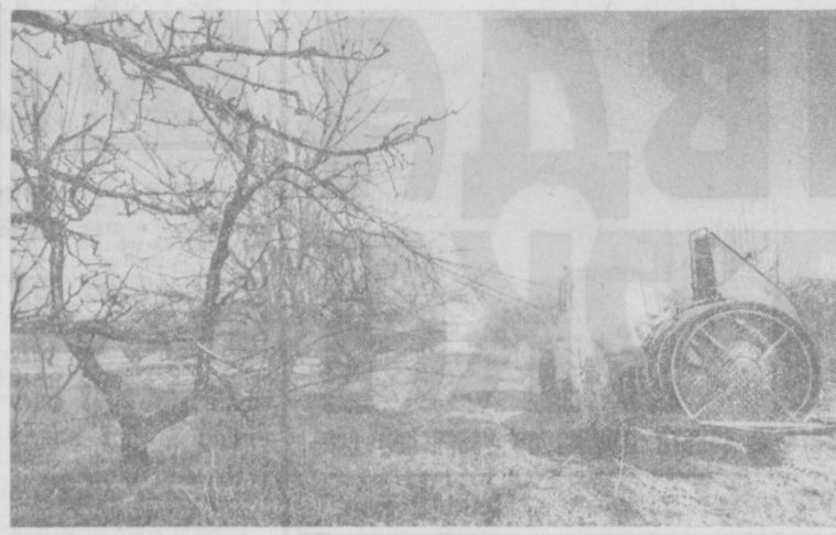
Более чем триста гектаров занимают садовые насаждения совхоза «Кибрай» Ташкентской области. В эти дни совхозные садоводы ведут химическую обработку фруктовых деревьев, что и заснято нашим фотокорреспондентом Л. Гусениным.

А. САИДОВ. Первый секретарь Анженского горкома партии.