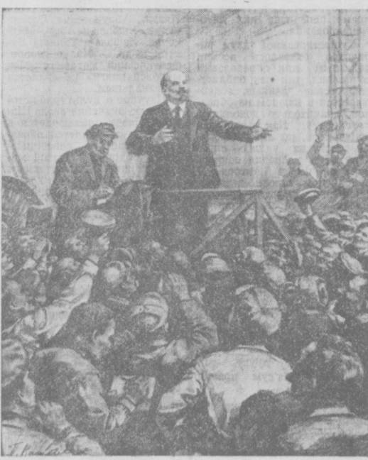
Выступление В. И. Ленина перед рабочими Обуховского завода (1917 г.). (Рисунок заслуженного деятеля искусства РСФСР П. Васильева).

15 марта были завершены переговоры между членом Политбюро ЦК КПСС, министром иностранных дел СССР А. А. Громыко и министром иностранных дел