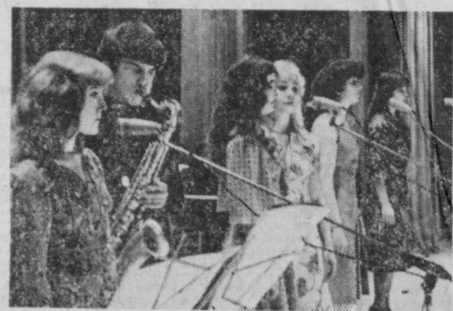
Давняя дружба связывает коллектив издательства ЦК Компартии Узбекистана с земляками из села «Малик» Сырдарьинского района. Представители их часто встречаются. Недавно группа полиграфистов побывала в подшефном хозяйстве. Они осмотрели центральную усадьбу, птицефабрику. Затем состоялся вечер дружно, на котором выступили народный агиттеатр «Голос полиграфиста», ансамбль современного балетного танца клуба «Красный печатник», а также самодеятельные артисты совхоза «Малик». На сцене слева — выступление агиттеатра; справа — поэт женский хор совхоза.

Янгиюль. (Общ. корр. А. Мениновская). В янгиюльском производственном объединении «Лаззат» готовится достойно встретить 50-летие первого пятилетнего плана. Сверх программы первого пятилетия в этом году продукция на 650 тысяч рублей, выработано сладких изделий на 10 тонн. Начался выпуск конфет «Фруза» и «Янгиюль» в художественных коробках с олимпийской символикой. 30 видов изделий удостоены Знака качества. Недавно в продукции с почетным патентом появились еще пять новинок: шоколадные батончики с ромовой начинкой, конфеты «Шодлан», батончики «Поладан» и «Сеннен».