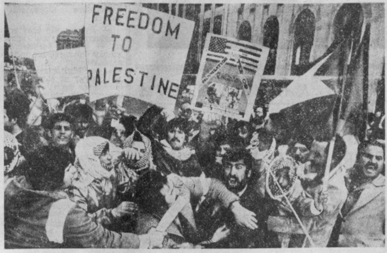
Массовая демонстрация протеста против сепаратного сговора Египта и Израиля, ущемляющего права арабского народа Палестины и других арабских народов, состоялась у здания Белого дома в Вашингтоне. Она была организована американцами арабского происхождения и арабскими студентами, обучающимися в США. На снимке: «Свобода Палестине» — начертано на лозунге манифестантов.

Участники встречи высказались за продолжение конструктивного диалога представителей общественности Советского Союза и Франции по актуальным проблемам современности.