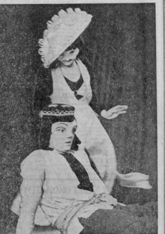
Народный театр Ташкентского политехнического института спектакль «Обо мне и о словах» по пьесе узбекского драматурга Абдурахмана Ибрагимова...