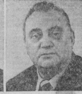
В. Ф. ГАРБУЗОВ. Министр финансов СССР.