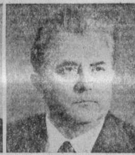
Н. Т. ГЛУШКОВ. Председатель Государственного комитета СССР по ценам.