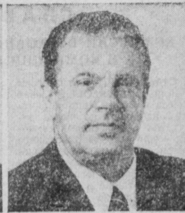
Г. А. КАРАВАЕВ. Министр строительства СССР.