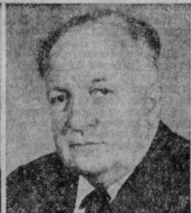
Б. В. ПЕТРОВСКИЙ. Министр здравоохранения СССР.