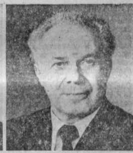
В. Г. ЛОМОНОСОВ. Председатель Государственного комитета СССР по труду и социальным вопросам.