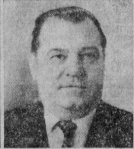
В. Ф. ЖИГАЛИН. Министр тяжелого и транспортного машиностроения СССР.