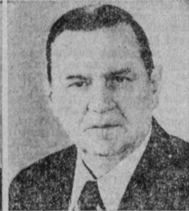
М. В. ЕГОРОВ. Министр судостроительной промышленности СССР.