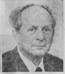
В. С. ДЫМШИЦ. Заместитель Председателя Совета Министров СССР.