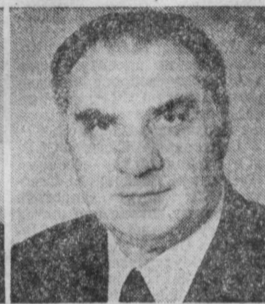
И. П. КАЗАНЕЦ. Министр черной металлургии СССР.