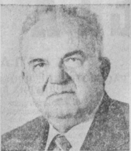
С. Ф. АНТОНОВ. Министр мясной и молочной промышленности СССР.