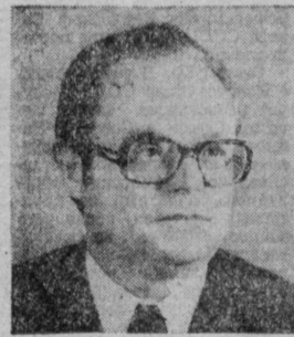
А. Н. АКСЕНОВ. Председатель Совета Министров Белорусской ССР.