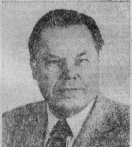
Т. Б. ГУЖЕНКО. Министр морского флота СССР.