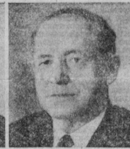
С. Г. ЛАПИН. Председатель Государственного комитета СССР по телевидению и радиовещанию.