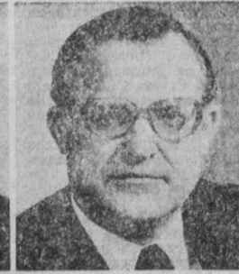
И. С. НАЙШЕК. Председатель Государственного комитета СССР по делам изобретений и открытий.