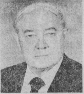
Л. В. СМЕРНОВ. Заместитель Председателя Совета Министров СССР.