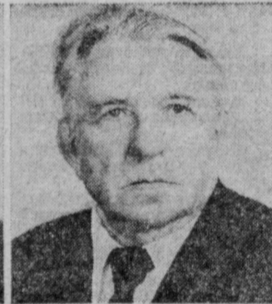
А. И. КОСТОУСОВ. Министр станкостроительной и инструментальной промышленности СССР.