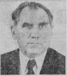
В. А. КАЗАКОВ. Министр авиационной промышленности СССР.