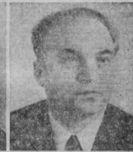
Г. И. ВОРОБЬЕВ. Председатель Государственного комитета СССР по лесному хозяйству.