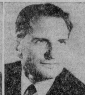
К. И. ГАЛАНШИН. Министр целлюлозно- бумажной промышленности СССР.