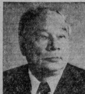
К. И. БРЕХОВ. Министр химического и нефтяного машиностроения СССР.