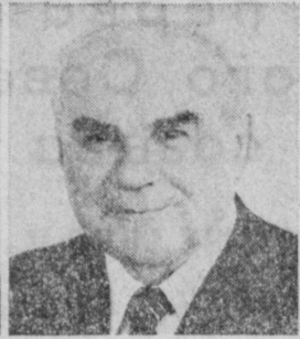
Н. К. БАЙБАКОВ. Заместитель Председателя Совета Министров СССР, председатель Государствен- ного планового комитета СССР.