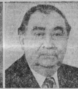
А. А. БУЛГАКОВ. Председатель Государственного комитета СССР по профессионально-техническому образованию.