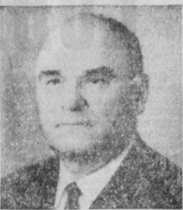
В. С. ФЕДОРОВ. Министр нефтеперерабатывающей и нефтехимической промышленности СССР.