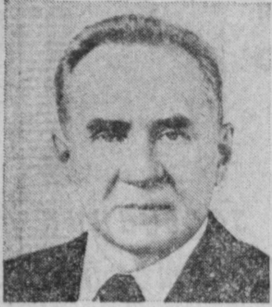
А. Н. КОСЫГИН. Председатель Совета Министров СССР.