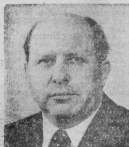
П. В. ТАЛЫЗИН. Министр связи СССР.