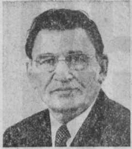
И. Т. НОВИКОВ. Заместитель Председателя Совета Министров СССР, председатель Государствен- ного комитета СССР по делам строительства.