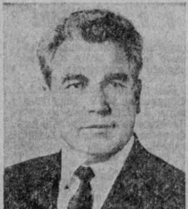
П. Н. ДЕМИЧЕВ. Министр культуры СССР.