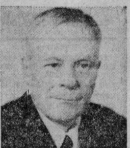
Л. Н. СМІРНОВ, Председатель Верховного Суда СССР.

Наряду с данными по СССР помещены некоторые сведения, характеризующие развитие экономики и культуры других социалистических стран. (ТАСС).