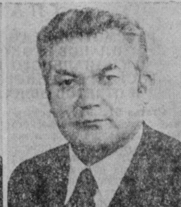
Р. НАБИЕВ. Председатель Совета Министров Таджикской ССР.