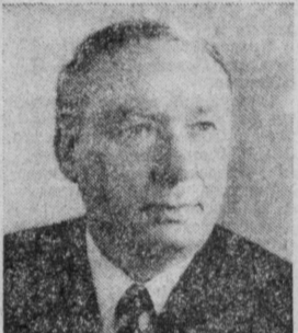
К. Н. БЕЛЯК. Министр машиностроения для животноводства и кормопроизводства СССР.