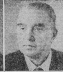
С. А. СКАЧКОВ. Председатель Государственного комитета СССР по внешним экономическим связям.