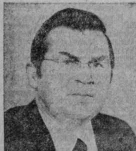
Е. А. КОЗЛОВСКИЙ. Министр геологии СССР.