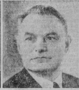
А. А. ЕЖЕВСКИЙ. Председатель Государственного комитета СССР по производственно-техническому обеспечению сельского хозяйства.