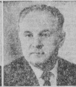
Н. В. ГОЛДИН. Министр строительства предприятий тяжелой индустрии СССР.