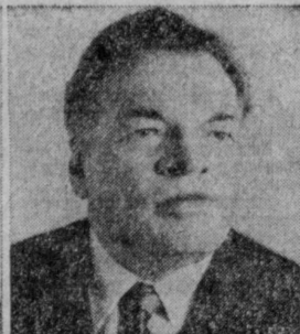
Г. С. ЗОЛОТУХИН. Министр заготовок СССР.