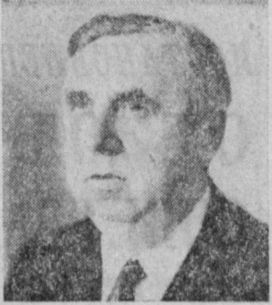
М. А. ЛЕСЕЧКО. Заместитель Председателя Совета Министров СССР.