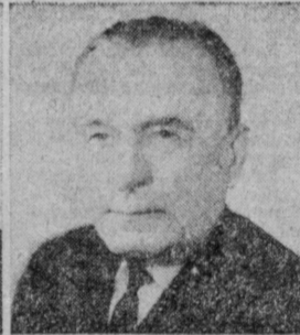
Е. С. НОВОСЕЛОВ. Министр строительного, дорожного и коммунального машиностроения СССР.