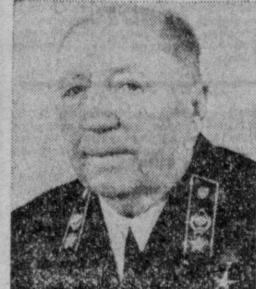
Р. А. РУДЕНКО, Генеральный прокурор СССР.

Председателю Союза коммунистов, Президенту Социалистической Федеративной Республики Югославия