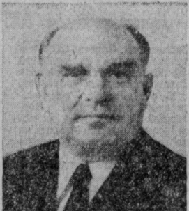
Н. Н. ТАРАСОВ. Министр легкой промышленности СССР.