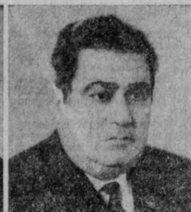
Л. А. КОСТАНДОВ. Министр химической промышленности СССР.