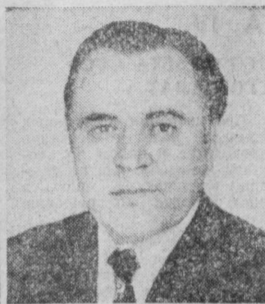
В. К. МЕСЯЦ. Министр сельского хозяйства СССР.