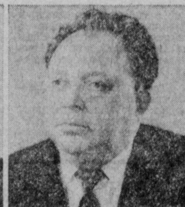
В. В. КРОТОВ. Министр энергетического машиностроения СССР.