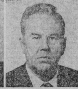
А. М. ШКОЛЬНИКОВ. Председатель Комитета народного контроля СССР.