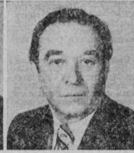
В. С. АЛХИМОВ. Председатель правления Государственного банка СССР.