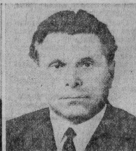
Н. А. ШЕЛОКОВ. Министр внутренних дел СССР.