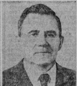
А. А. ГРОМЬКО. Министр иностраных дел СССР.