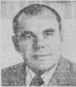
А. М. ТОКАРЕВ. Министр промышленного строительства СССР.