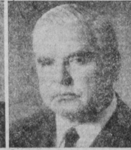
В. В. БОЙПОВ. Председатель Государственного комитета СССР по стандартам.