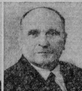
А. И. ШОКИН. Министр электронной промышленности СССР.