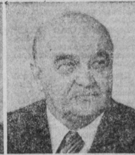
В. И. ТЕРЕВИЛОВ. Министр юстиции СССР.