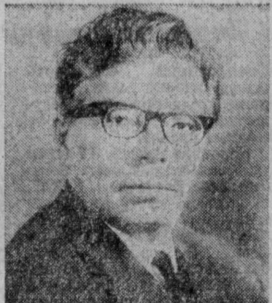
Н. В. ТИМОФЕЕВ. Министр лесной и деревообрабатывающей промышленности СССР.