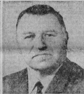
С. А. АФАНАСЬЕВ. Министр общего машиностроения СССР.