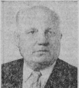
В. В. БАХИРЕВ. Министр машиностроения СССР.