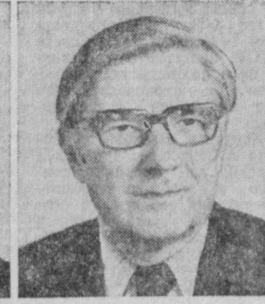
Б. Ф. БРАТЧЕНКО. Министр угольной промышленности СССР.