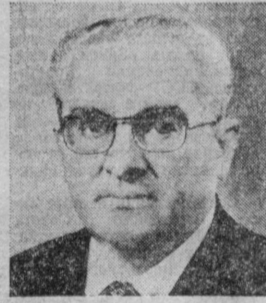
Ю. В. АНДРОПОВ. Председатель Комитета государственной безопасности СССР.