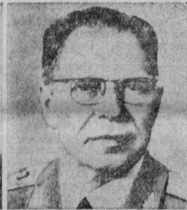
Д. Ф. УСТИНОВ. Министр обороны СССР.