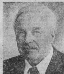
П. Ф. ЛОМАКО. Министр цветной металлургии СССР.