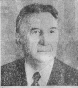
П. В. АРХИПОВ. Заместитель Председателя Совета Министров СССР.