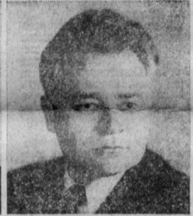
П. С. ПЛЕШАКОВ. Министр радиопромышленности СССР.