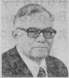
В. А. КИРИЛЛИН. Заместитель Председателя Совета Министров СССР, председатель Государствен- ного комитета СССР по науке и технике.