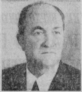
Т. Я. КИСЕЛЕВ. Заместитель Председателя Совета Министров СССР.