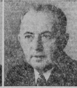
Л. М. ВОЛОДАРСКИЙ. Начальник Центрального статистического управления СССР.