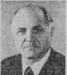
И. И. ПУДКОВ. Министр машиностроения для легкой и пищевой промышленности и бытовых приборов СССР.