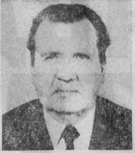
Н. В. МАРТЫНОВ. Заместитель Председателя Совета Министров СССР, председатель Государственного комитета СССР по материаль- но-техническому снабжению.