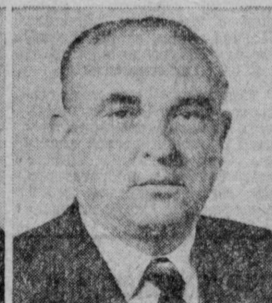
А. К. АНТОНОВ. Министр электротехнической промышленности СССР.