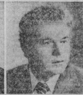
С. К. ГРОССУ. Председатель Совета Министров Молдавской ССР.