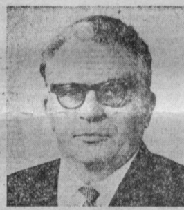
А. А. КОКАРЕВ. Председатель Государственного комитета СССР по материальным резервам.