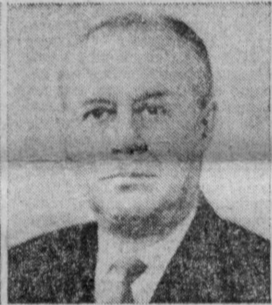
К. Н. РУДНЕВ. Министр приборостроения, средств автоматизации и систем управления СССР.