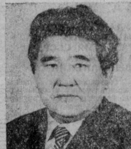
С. И. ИБРАИМОВ. Председатель Совета Министров Киргизской ССР.