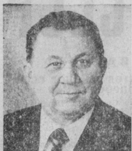
Б. В. БАКИН. Министр монтажных и специальных строительных работ СССР.