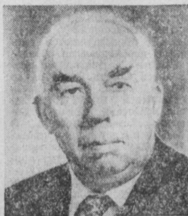
С. Д. ХИТРОВ. Министр сельского строительства СССР.