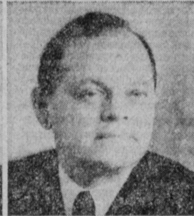
Б. Е. ШЕРБИНА. Министр строительства предприятий нефтяной и газовой промышленности СССР.