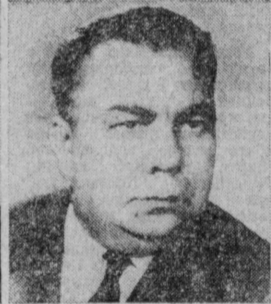
И. Ф. СИНИЦЫН. Министр тракторного и сельскохозяйственного машиностроения СССР.