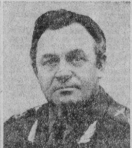
Б. П. БУГАЕВ. Министр гражданской авиации СССР.