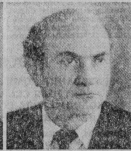
З. А. ПАТАРДЗЕ. Председатель Совета Министров Грузинской ССР.