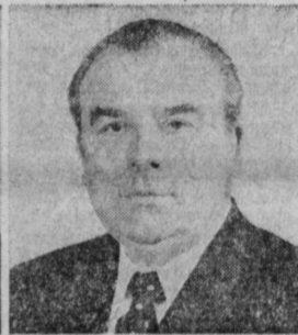
П. В. ФИНОГЕНОВ. Министр оборонной промышленности СССР.