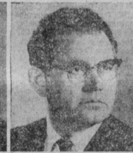
Б. И. СТУКАЛИН. Председатель Государственного комитета СССР по делам издательства, полиграфии и книжной торговли.