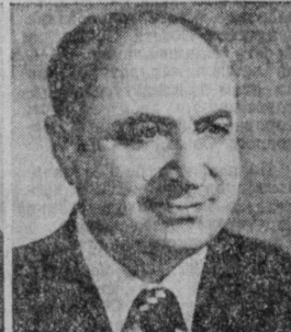
Ф. Т. САРКИСЯН. Председатель Совета Министров Армянской ССР.