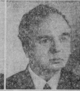
А. П. ЛЯШКО. Председатель Совета Министров Украинской ССР.