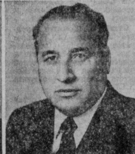
Ч. С. КАРРЫЕВ. Председатель Совета Министров Туркменской ССР.