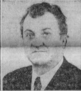
И. Г. ПАВЛОВСКИЙ. Министр путей связи СССР.