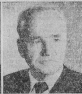
П. С. НЕПОРОЖНИЙ. Министр энергетики и электрификации СССР.