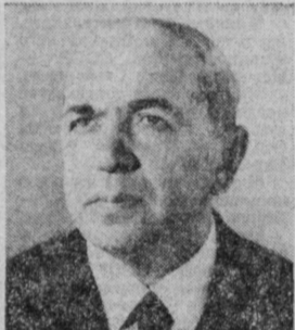
С. А. ОРУДЖЕВ. Министр газовой промышленности СССР.