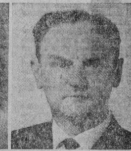
Ю. Я. РУБЕН. Председатель Совета Министров Латвийской ССР.