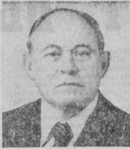
А. И. ЯШИН. Министр промышленности стрелочных материалов СССР.