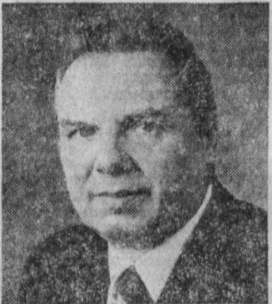
А. К. МЕЛЬНИЧЕНКО. Министр медицинской промышленности СССР.