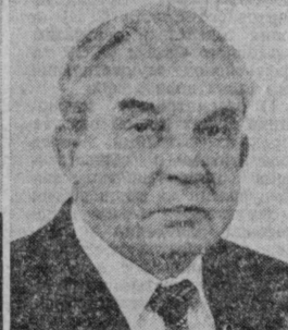
В. И. КЛАУСОН. Председатель Совета Министров Эстонской ССР.