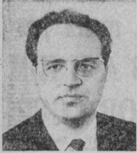
К. Ф. КАТУШЕВ. Заместитель Председателя Совета Министров СССР.