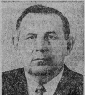
Н. Ф. ВАСИЛЬЕВ. Министр мелководной и водного хозяйства СССР.