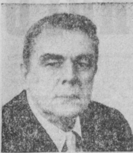
В. П. ЛЕИН. Министр пищевой промышленности СССР.