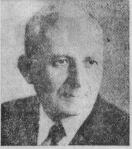
В. Н. ПОЛЯКОВ. Министр автомобильной промышленности СССР.