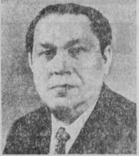
З. Н. НУРИЕВ. Заместитель Председателя Совета Министров СССР.