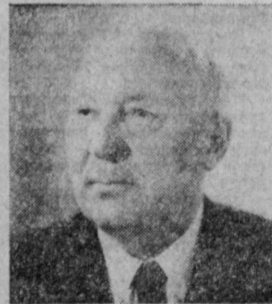
Е. П. СЛАВСКИЙ. Министр среднего машиностроения СССР.