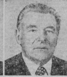
М. С. СОЛОМЕНЦЕВ. Председатель Совета Министров РСФСР.