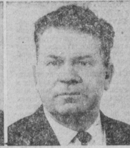
А. М. СТРУЕВ. Министр торговли СССР.