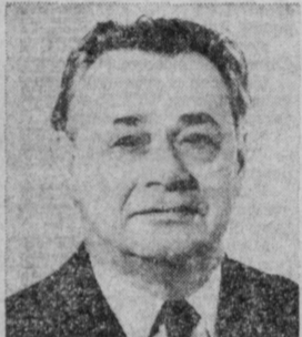
Н. С. ПАТОЛИЧЕВ. Министр внешней торговли СССР.