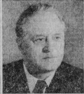
И. Д. СОСНОВ. Министр транспортного строительства СССР.