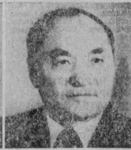
Б. А. АШИМОВ. Председатель Совета Министров Казахской ССР.