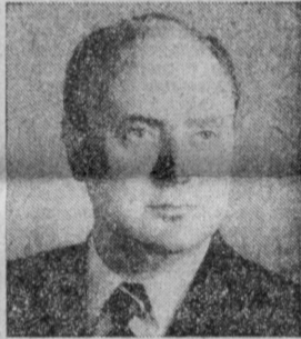
З. К. ПЕРВЫШИН. Министр промышленности средств связи СССР.