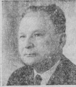
М. А. ПРОКОФЬЕВ. Министр просвещения СССР.