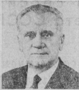
Н. А. ТИХОНОВ. Первый заместитель Председателя Совета Министров СССР.