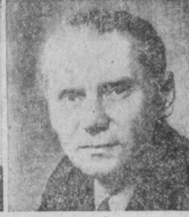
В. М. КАМЕНЦЕВ. Министр рыбного хозяйства СССР.