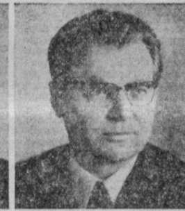
Ф. Т. ЕРМАШ. Председатель Государственного комитета СССР по кинематографии.