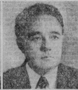
П. Д. ХУДАЙБЕРДИЕВ. Председатель Совета Министров Узбекской ССР.