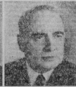
А. И. ИБРАГИМОВ. Председатель Совета Министров Азербайджанской ССР.