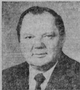
Н. А. МАЛЬЦЕВ. Министр нефтяной промышленности СССР.