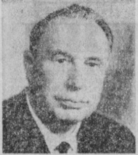
В. Н. НОВИКОВ. Заместитель Председателя Совета Министров СССР.