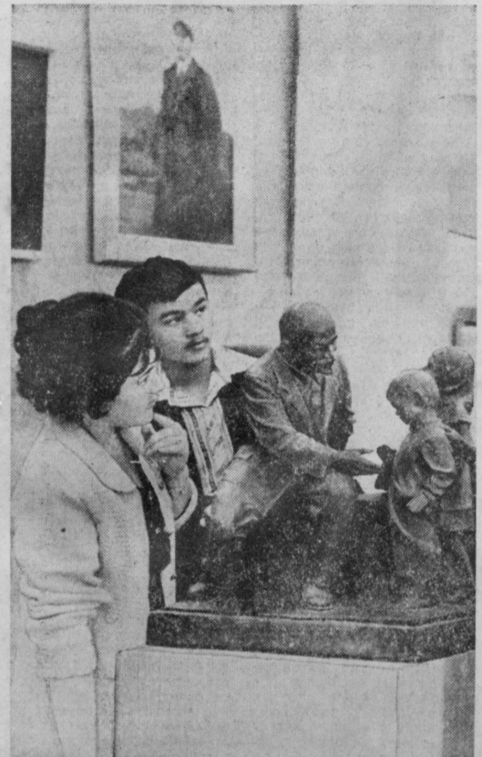
В эти дни в залах Ташкентского филиала Центрального музея имени В. И. Ленина.