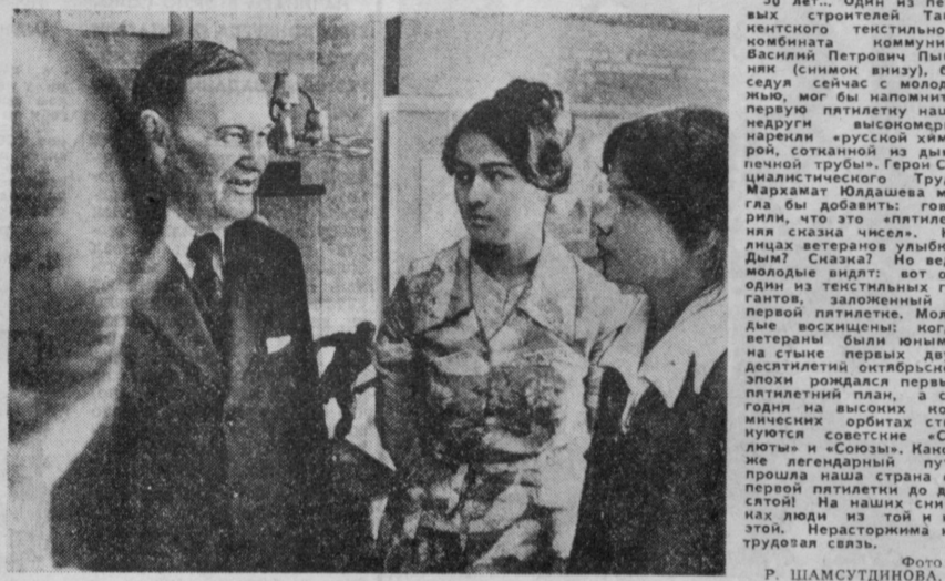
СЛОВО — ВЕТЕРАНАМ