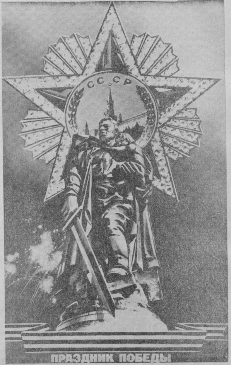
Плакат художника В. Викторова.

9 МАЯ 1945 г. СТОЛИЦА НАШЕЙ РОДИНЫ — МОСКВА ЗА ЗАЛПАМИ ИЗ ТЫСЯЧИ ОРУДИЙ ВОЗВЕСТИЛА МИРУ О НАШЕЙ ВЕЛИКОЙ ПОБЕДЕ.