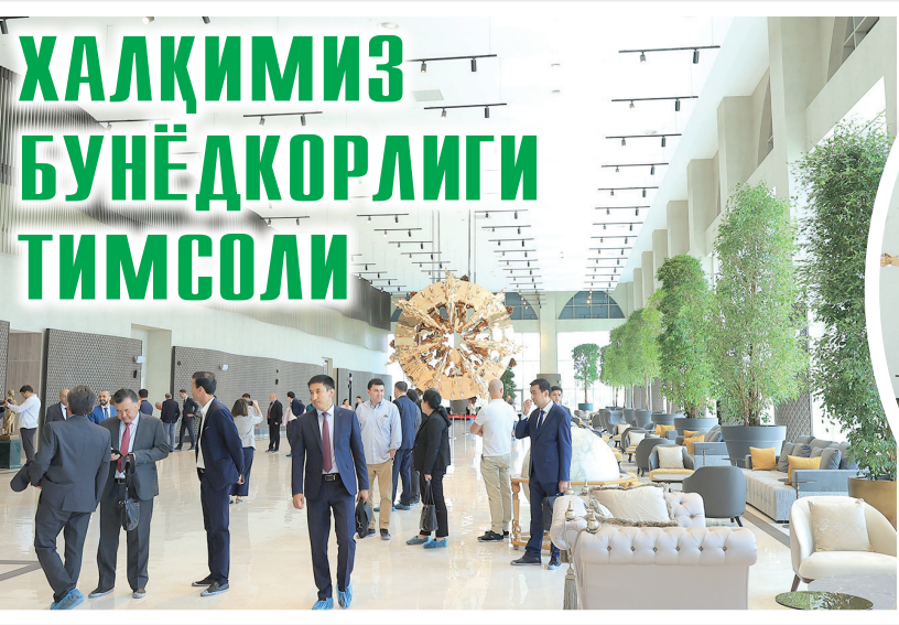
(Давоми. Бошланиши 1-саҳифада).

"Боқий шаҳар" меъморий ансамблини айтмайсизми?! 7 гектар майдонда жонажон Ўзбекистонимизнинг дурдонаси яратилди. Самарқанд, Бухоро, Хива ва бошқа тарихий шаҳарларимиздаги тарихий-меъморий обидаларнинг андозаси, қадимий шарқона бозор, юртимиз 14 худудининг ўзига хос хунармандчилик анъаналари, одамлар турмуш тарзи шу масканда ўз ифодасини топган. Бу ердаги Риштон кулолчилиги, Бухоро зардўзлиги, Қорақалпоқ ўтови, Марғилон атласи, Самарқанд ноилари ҳар бир сайёҳ учун қизиқарли, ҳайратланарли бўлиши табиий.