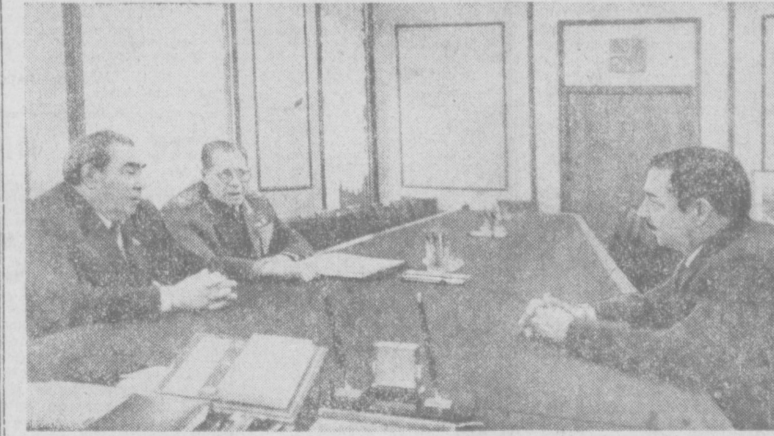
На снимке: во время беседы.