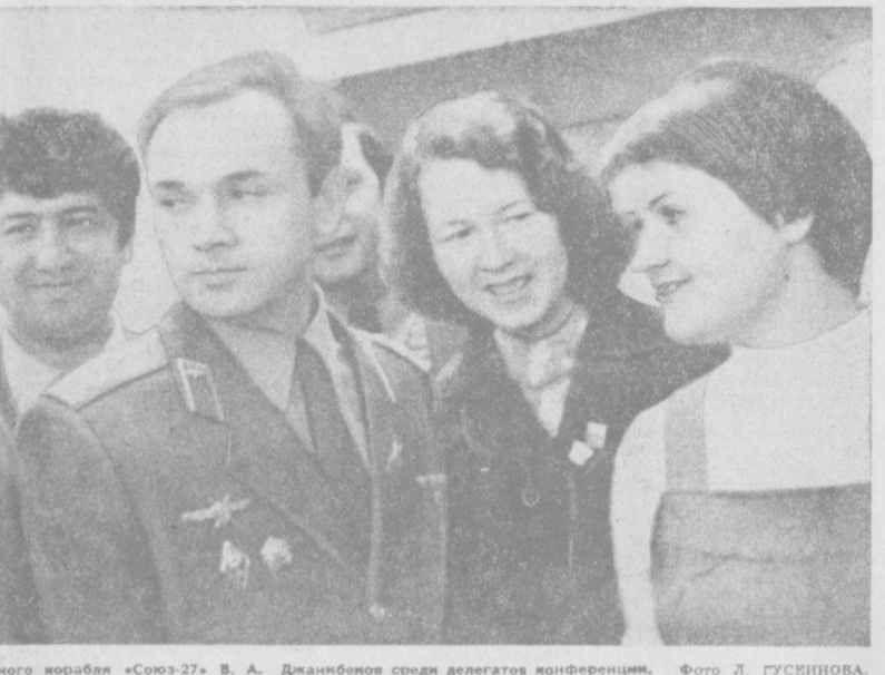
На снимке: командир космического корабля «Союз-27» В. А. Джанибеков среди делегатов конференции.