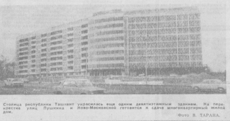
Столица республички Ташкент украсилась еще одним девятиэтажным зданием. На проспекте улиц Пушкина и Ново-Московской готовится к сдаче многоквартирный жилой дом.

Надеждам политический литературы выдано пособие «Избранные речи и статьи» члена Политбюро ЦК КПСС, секретаря ЦК КПСС Ф. Д. Кулакова. Книга включает речи, доклады и статьи за период 1965—1977 годов, освещающие актуальные вопросы внутренней и внешней политики, а также развитие сельского хозяйства на современном этапе. Сборник «Избранные речи и статьи» рассчитан на партийный и хозяйственный актив, пропагандистов, специалистов в области науки, а также на более широкий круг других читателей. Он выпускается массовым тиражом. (ТАСС).