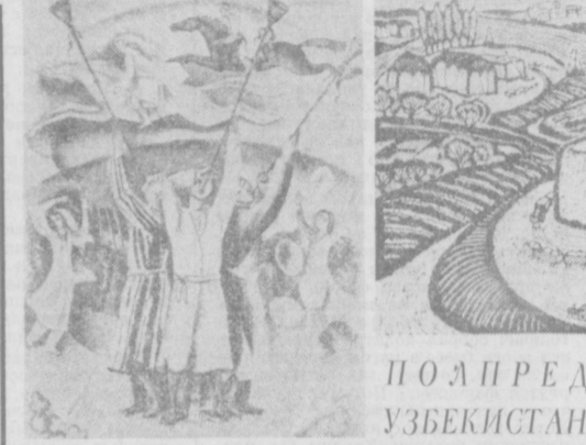
ПОЛПРЕДЫ ГРАФИКИ УЗБЕКИСТАНА ЗА РУБЕЖОМ