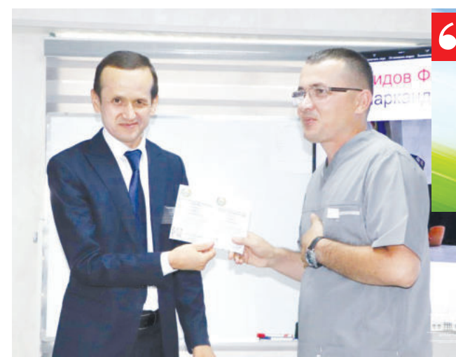
“ЎТГАН 2017–2021 ЙИЛЛАР ДАВОМИДА АҚШ, ХИТОЙ, ЖАНУБИЙ КОРЕЯ, ТУРКИЯ ВА БОШҚА ДАВЛАТЛАРДАН ЖАМИ 1 262,7 МИНГ АҚШ ДОЛЛАРИ ҲАМДА 1 МИЛЛИАРД 370 МИЛЛИОН СЎМ МИҚДОРИДАГИ ЗАМОНАВИЙ ТИББИЁТ УСКУНАЛАРИ ОЛИБ КЕЛИБ, ЎРНАТИЛДИ.

Клиникада бир кунда ўртача 450 дан ортиқ беморга тиббий хизмат кўрсатилмоқда. Шунингдек, аҳолининг кам таъминланган, ҳимояга муҳтож, уруш фахрийлари ва ногиронлик бўйича нафақа оладиган тоифадаги қисмига бепул хизмат кўрсатиш ҳам йўлга қўйилган. Ўтган 2017–2021 йиллар давомида