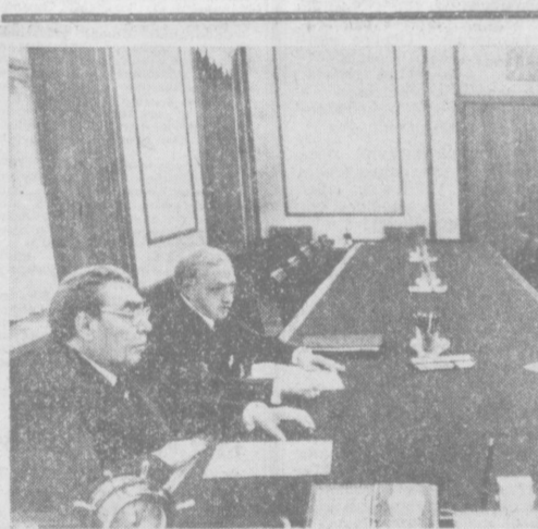
На снимке: во время беседы.

Значительность этого достижения в нашей республике Г.