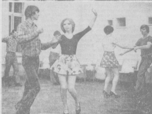
При ферганском Дворце культуры «Нефитини» работает инструментальный ансамбль «Радуга» и танцевальный клуб «Фламинго». Оба коллектива пользуются заслуженным успехом у зрителей. Летом прошлого года коллектив «Радуга» стал лауреатом Всесоюзного фестиваля самодельного художественного творчества трудящихся. Лауреатами этого же фестиваля стали две пары клуба «Фламинго». Кроме того, ансамбль «Радуга» завоевал третье место в I республиканском диалектальном фестивале «Фергана-77». На снимках: на репетициях ансамбля «Радуга» (вверху) и «Фламинго».