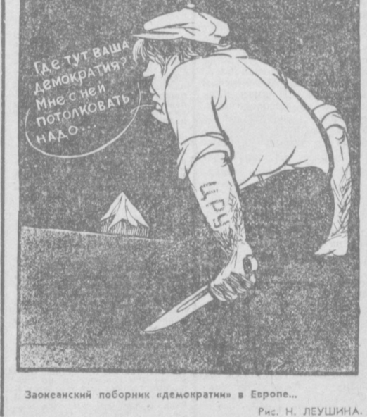
Законский поборник «демократии» в Европе... Рис. Н. ЛЕУШИНА.