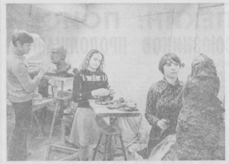
В студии изобразительного искусства Дворца культуры Ташкентского текстильного комбината занимается более 200 человек. Среди них — рабочие, инженеры, школьники. Они постигают основы живописи, графики, скульптуры, керамики, резьбы по дереву, чеканки. Но самое главное — они входят в необычный мир искусства, учатся понимать и любить красоту. На снимке: студийцы за работой.

РЕСТАВРИРУЮТ ПАМЯТНИКИ БУХАРА. (Соб. корр.). 648 памятников старины имеются на территории области. Многие из них — раскопанного и республиканского значения, три взяты на учет ЮНЕСКО. Для их охраны всемерно принимаются меры. Каждый памятник, как мавзолей, как картина художника, нуждается в уходе. В минувшее пятилетие полностью реконструировано одиннадцать памятников. Сейчас работы ведутся на пятнадцати объектах, в том числе на знаменитом мавзолее Марки-Аттари, Арике. На очереди — другие сооружения старины.