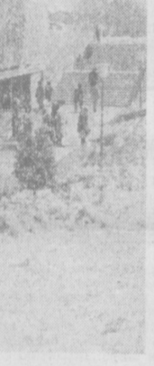
ТАШКЕНТ СЕГОДНЯ. Вход в метро на станции «Площадь В. И. Ленина».