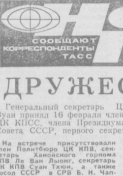
На встрече присутствовали члены Политбюро ЦК КПВ, секретари Ханойского горкома ЦК КПВ Ле Ван Лыонг, секретарь ЦК КПВ Суан Тхион, а также посол СССР в СРВ Б. Н. Чаплин.

От имени Генерального секретаря ЦК КПСС, Председателя Президиума Верховного Совета СССР Леонида Ильича Брежнева, членов Политбюро ЦК КПСС Г. В. Романова передал Ле Зуану, члену Политбюро ЦК КПВ, всему братскому вьетнамскому народу сердечный привет и пожелания дальнейшего успеха в развитии социалистического строительства. Он подчеркнул, что советские коммунисты придадут важное значение дальнейшему развитию советско-вьетнамского дружбы, КПСС оказывает неизменно поддержку курсу 19 съезда Коммунистической партии Вьет-