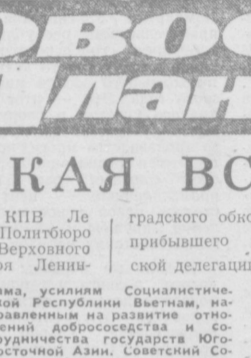
Генеральный секретарь ЦК КПВ Ле Зуан принял 16 февраля члена Политбюро ЦК КПСС, члена Президиума Верховного Совета СССР, первого секретаря Ленинградского обкома КПСС Г. В. Романова, прибывшего во Вьетнам во главе советской делегации.