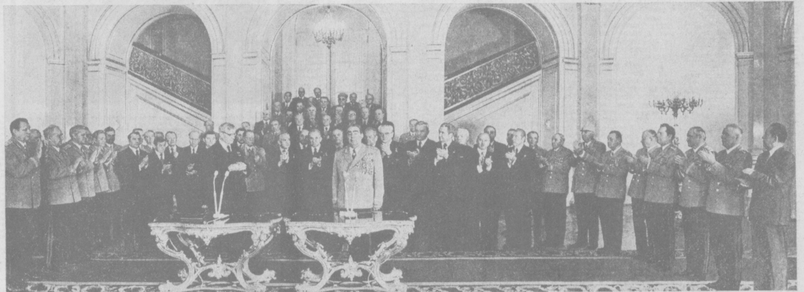
Во время вручения награды.

О награждении Генерального секретаря Центрального Комитета КПСС, Председателя Президиума Верховного Совета СССР, Председателя Совета Оборона СССР Маршала Советского Союза БРЕЖНЕВА Леонида Ильича орденом «Победа»