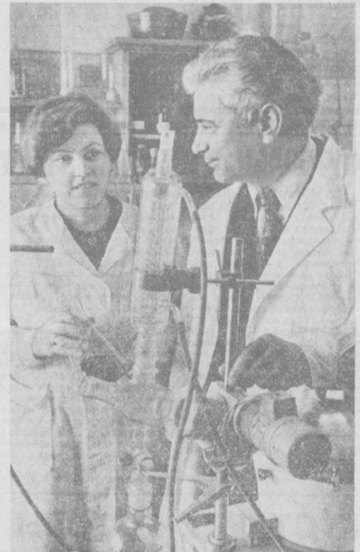
В лабораториях ученых

Мих. ПРУДЕР, Собр. корр. «Правды Востока», Чиназский район.