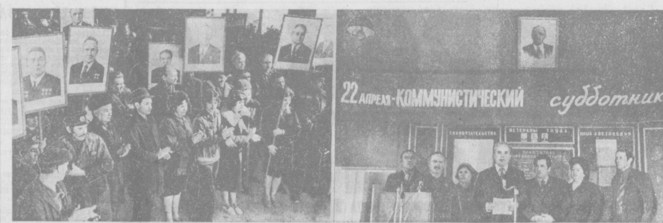
На снимках: во время митинга на заводе имени Октябрьской революции.